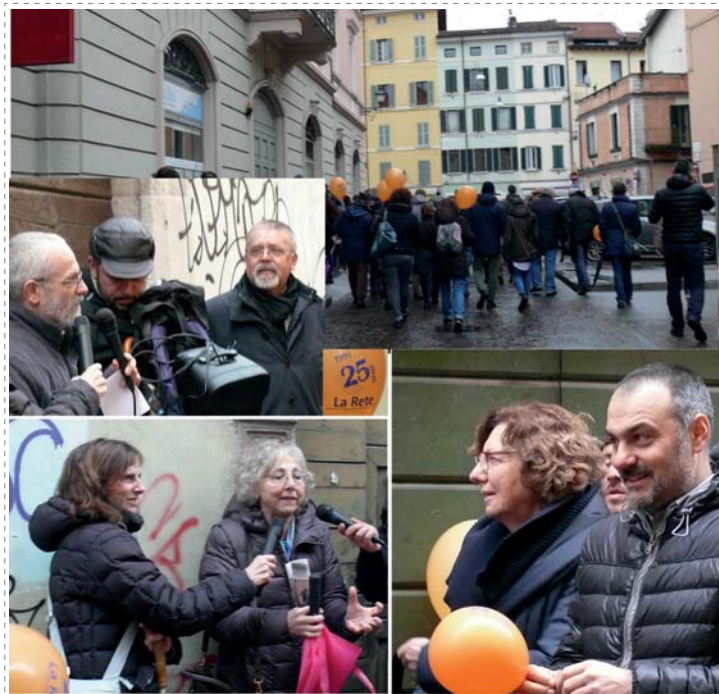
28 febbraio 2016: Venticinque anni di storia della cooperativa La Rete nelle strade della città

«La Rete» è una cooperativa partita dalla strada e dalla volontà di includere le vittime dell'emarginazione per progettare servizi sociali volti alla promozione delle persone, al riconoscimento della loro dignità, al loro accesso ai diritti. Nel 2016 abbiamo investito molto, in particolare a fianco di fio.PSD, per sostenere sul territorio cittadino ed al nostro interno processi di riprogettazione e rilancio dei servizi per la grave marginalità.